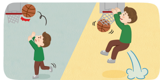
<Two Years Ago>