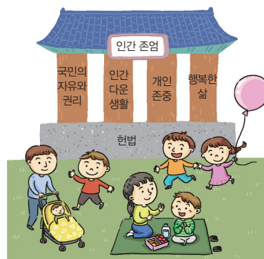
▲ 헌법의 내용